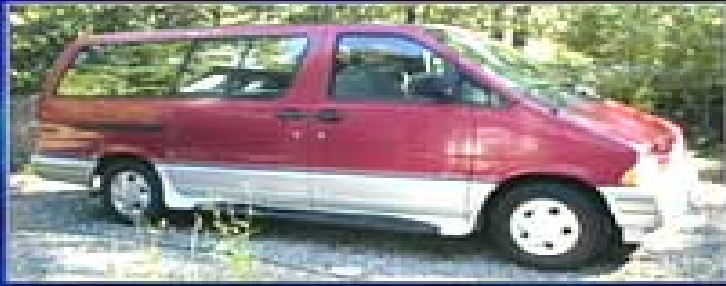
Ford Aerostar années 80